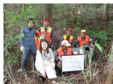
盛岡猟友会のメンバー