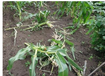
被害(デントコーン)