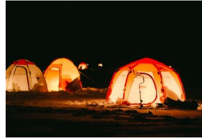
岩洞湖水上ワカサギ釣り