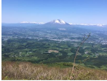
姫神山から見た玉山地域