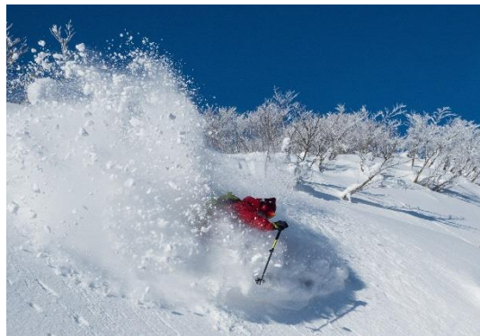
パウダースノーが魅力「夏油高原スキー場」