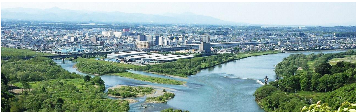
北上川と和賀川の合流点（北上駅付近）

半導体、自動車、金属加工、食品製造等の多種多様な立地企業と、地元の中小企業とが一体となった当市は、岩手県内有数の産業のまちとして市内外から多くの人が働きに訪れています。