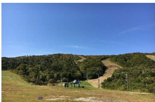
活動拠点となる「夏油高原スキー場」

夏油高原スキー場の活動にも参画して運営方法や現在の状況等を学び、「株式会社北日本リゾート」と協力し、支援も受けながら、アイデアを活かして活動していただきます。