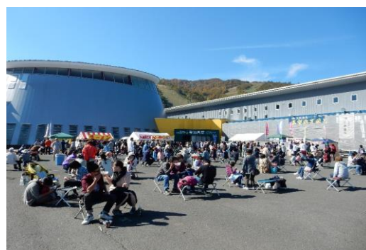
「夏油高原紅葉まつり」