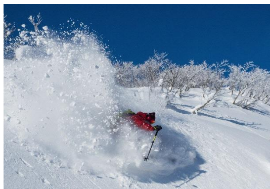
パウダースノーが魅力「夏油高原スキー場」